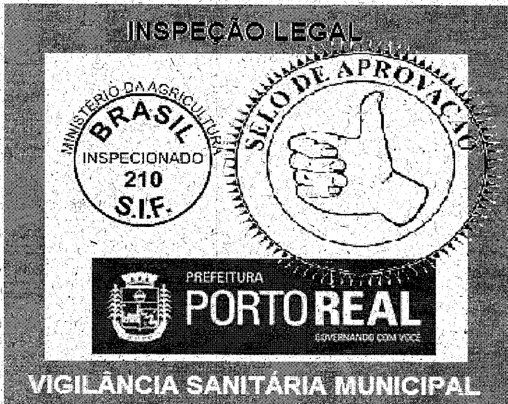
ILUSTRAÇÃO PARA FÁCIL VISUALIZAÇÃO

Estado do Rio de Janeiro Poder Legislativo