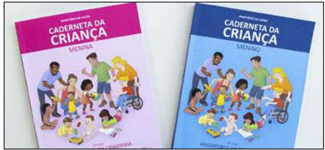
• Governo tem adotado medidas para vacinação infantil