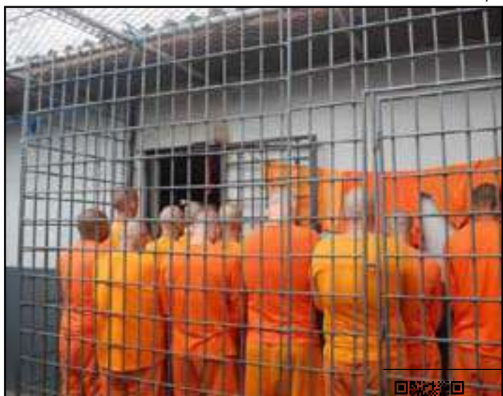
• Presos relatam que agentes com violência e que a infraestrutura é precária, favorecendo a doenças e a falta de água e comida

Em nota, a Alerj esclarece que o afastamento das atividades parlamentares cria uma situação inédita no Parlamento, pois pela primeira vez a composição da Casa é alterada mediante medida cautelar e sem a prisão. Diante disso, diz o comunicado, é necessário aguardar um parecer da Procuradoria.