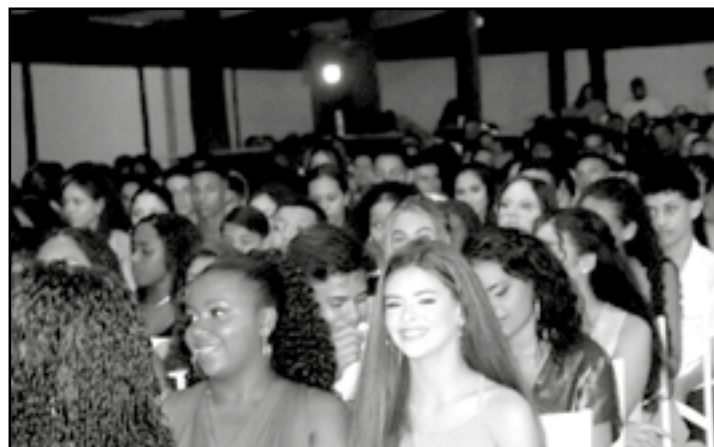
• O evento celebrou a conclusão de mais uma etapa escolar dos estudantes rumo ao ensino médio

O evento contou com espaço decorado, sonorização, plataforma para vídeo 360º, foto-lembran-