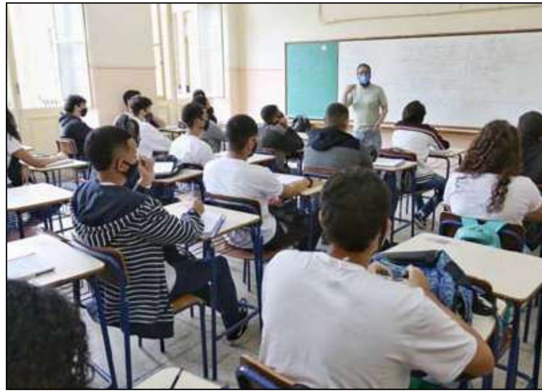
• Modelo atual está em vigor desde 2017

A Câmara dos Deputados deve encerrar o ano de 2023 sem votar, em plenário, o projeto de lei enviado pelo presidente Luiz Inácio Lula da Silva (PT) para alterar o formato do Novo Ensino Médio, instituído em 2017.