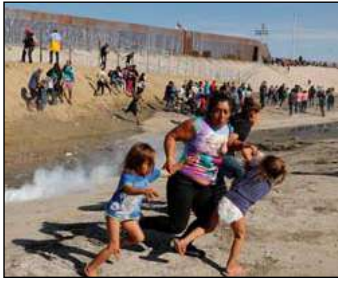
• Patrulha apreendeu cerca de 10.800 imigrantes

Companhias ferroviárias e grupos empresariais estão pressionando o governo dos Estados Unidos para reabrir rotas comerciais na fronteira entre o Texas e o México, após as autoridades fecharem dois pontos de passagem em resposta a um crescimento de imigrantes nos últimos dias. A Patrulha de Fronteira dos EUA apreendeu cerca de 10.800 imigrantes na fronteira sudoeste nesta semana, segundo um relatório interno da agência revisado pela Reuters. Cerca de 40% eram famílias ou crianças sem acompanhantes.