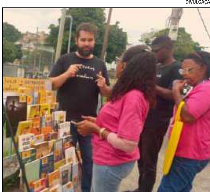
• Projeto contribui para a formação cultural, literária e educativa

Cerca de 100 mil livros já foram libertados nas ações desde o início das atividades. Dessa forma, o projeto