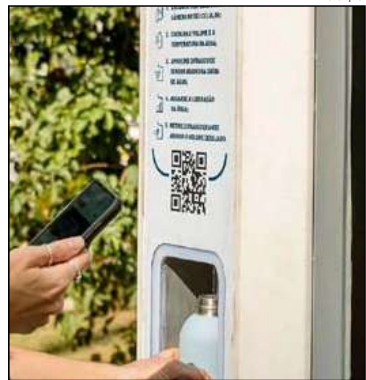
• Primeiro equipamento foi colocado no Parque Garota de Ipanema

As outras 25 estações serão colocadas entre a própria Zona Sul e a Zona Norte, a partir de janeiro, em locais onde a Mude já possui espaços de bem-estar.