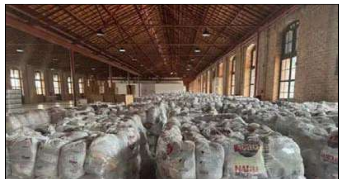
• Cestas vão beneficiar mais de 800 mil pessoas

O evento de entrega do Natal Sem Fome está agendado para hoje (21