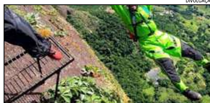
• Corpo de Jorge Spanner precisou ser resgatado por uma aeronave do Corpo dos Bombeiros em uma área de mata

O ex-surfista profissional Jorge Spanner, de 37 anos, morreu ontem (20) após fazer um salto de base jump na Pedra da Gávea, na Barra da Tijuca, Zona Oeste.