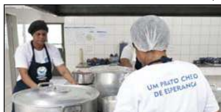
• Rio conta com cozinhas comunitárias em diversos bairros

Trabalho e Renda (SMTE). E, a exemplo das outras cozinhas, elas beneficiarão famílias pobres em situação de vulnerabilidade econômica na cidade. A primeira cozinha inaugurada nesta quarta-feira foi a do Terreirão. Administrada pela SMTE, em parceria com o Instituto Vida e cogestão do Instituto Realizando o Futuro, ela funciona na Avenida Jarbas de Carvalho, 1.580, no Recreio dos Bandeirantes. Instalada em um prédio que estava há oito anos desativado, a cozinha comunitária do Cos-