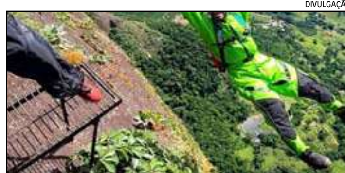
• Corpo de Jorge Spanner precisou ser resgatado por uma aeronave do Corpo dos Bombeiros em uma área de mata

O ex-surfista profissional Jorge Spanner, de 37 anos, morreu ontem (20) após fazer um salto de base jump na Pedra da Gávea, na Barra da Tijuca, Zona Oeste.