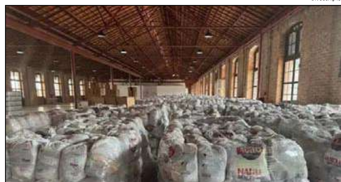
• Cestas vão beneficiar mais de 800 mil pessoas

O evento de entrega do Natal Sem Fome está agendado para hoje (21)