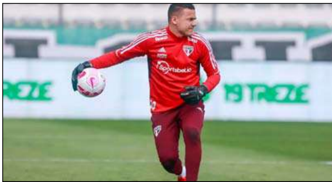
• Tricolor quer contar com o arqueiro para a próxima temporada