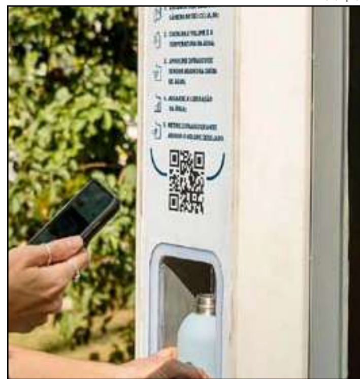
• Primeiro equipamento foi colocado no Parque Garota de Ipanema

As outras 25 estações serão colocadas entre a própria Zona Sul e a Zona Norte, a partir de janeiro, em locais onde a Mude já possui espaços de bem-estar.