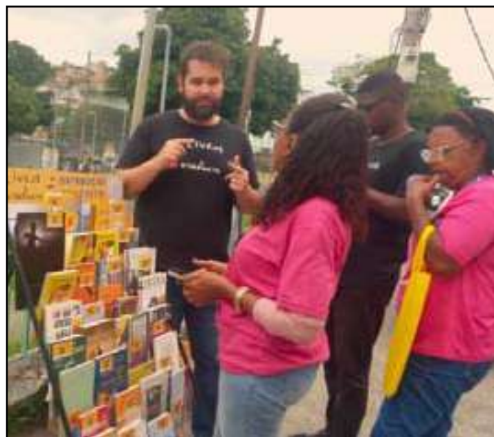
• Projeto contribui para a formação cultural, literária e educativa

Cerca de 100 mil livros já foram libertados nas ações desde o início das atividades. Dessa forma, o projeto