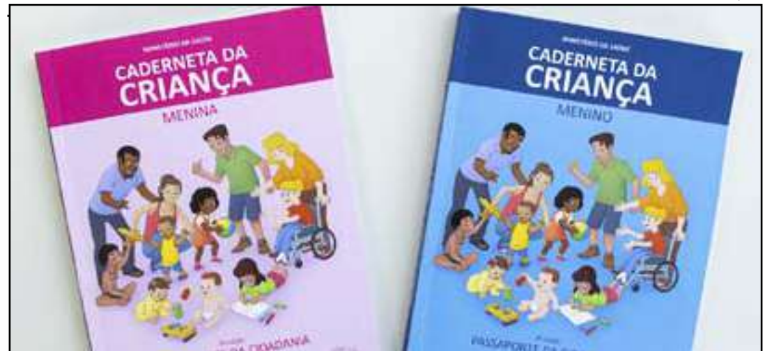
• Governo tem adotado medidas para vacinação infantil