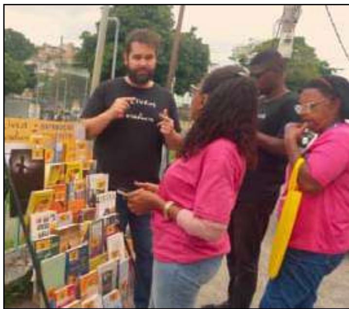
• Projeto contribui para a formação cultural, literária e educativa

Cerca de 100 mil livros já foram libertados nas ações desde o início das atividades. Dessa forma, o projeto