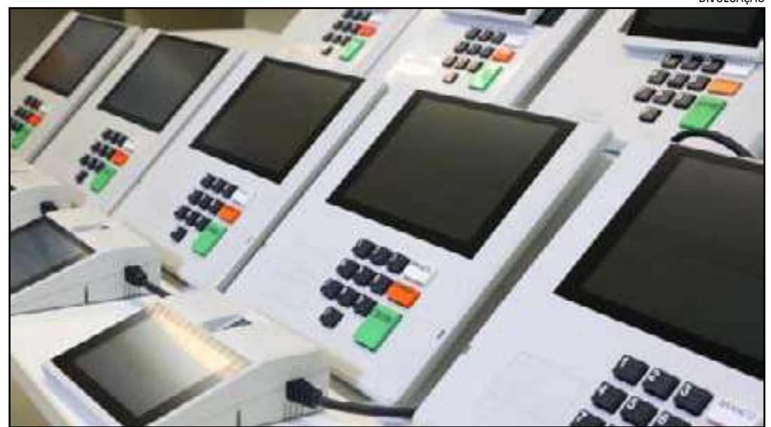
• Máquinas serão usadas nas eleições municipais

Um dos destaques foi em relação a fraudes na cota de gênero. Ao longo do ano, o TSE julgou ao menos 60 casos sobre o assunto, estabelecendo critérios rígidos para avaliar campanhas femininas falsas, por exemplo.