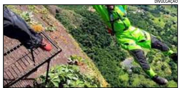
• Corpo de Jorge Spanner precisou ser resgatado por uma aeronave do Corpo dos Bombeiros em uma área de mata

O ex-surfista profissional Jorge Spanner, de 37 anos, morreu ontem (20) após fazer um salto de base jump na Pedra da Gávea, na Barra da Tijuca, Zona Oeste.