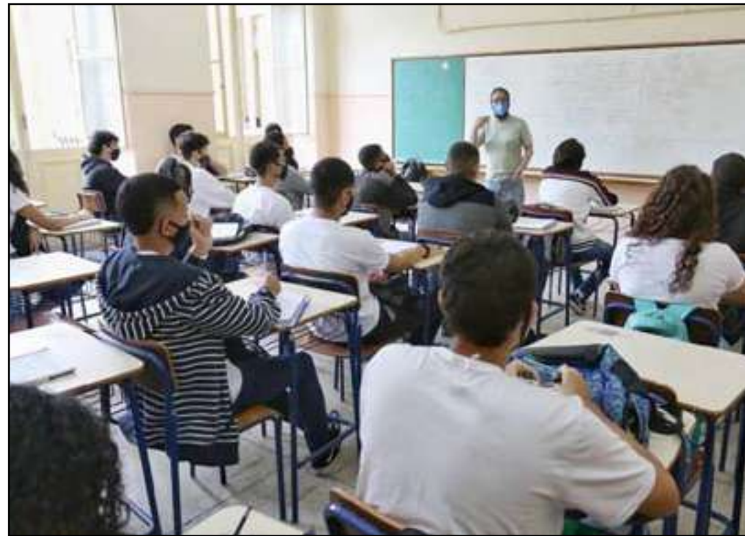
• Modelo atual está em vigor desde 2017

A Câmara dos Deputados deve encerrar o ano de 2023 sem votar, em plenário, o projeto de lei enviado pelo presidente Luiz Inácio Lula da Silva (PT) para alterar o formato do Novo Ensino Médio, instituído em 2017.