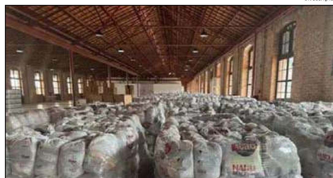
• Cestas vão beneficiar mais de 800 mil pessoas

O evento de entrega do Natal Sem Fome está agendado para hoje (21)