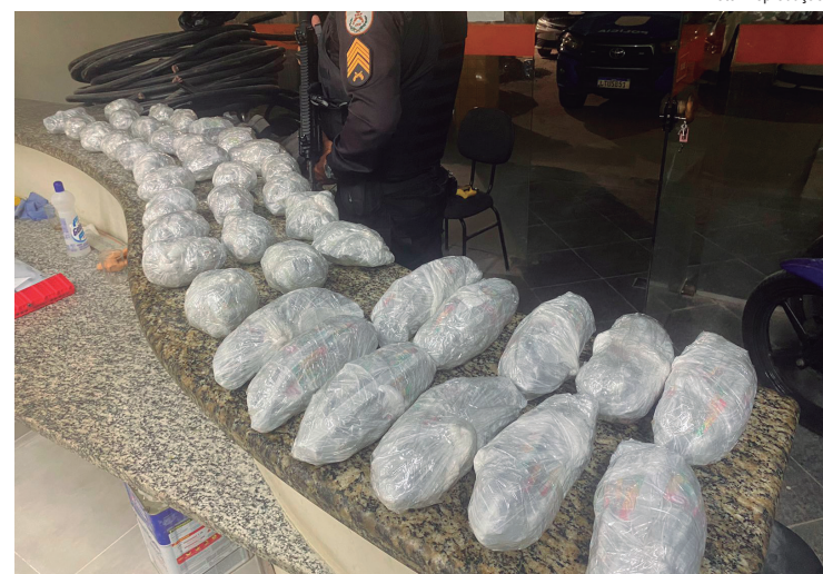
Drogas seriam levadas para a cidade de Barra do Pirai