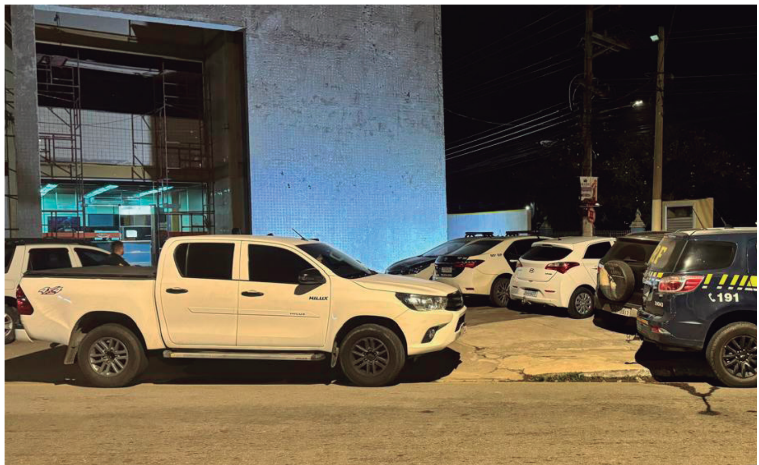
O carro original – de mesmo modelo, marca e cor – tinha registro de roubo em 2022