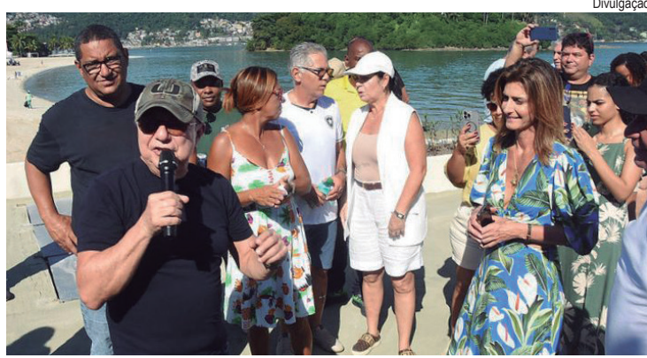
Expectativa é que a Praia do Anil volte a ser balneável nos próximos meses

- Todo o esgoto que caia na Praia do Anil, não cai mais. A água já está bem clara. A cada dia que passa, as marés vão reciclando o ambiente da praia. Esperamos que em breve ela esteja completamente balneável, pronta para receber os moradores locais e os turistas. Estamos comprometidos em continuar investindo em projetos de saneamento e preservação ambiental