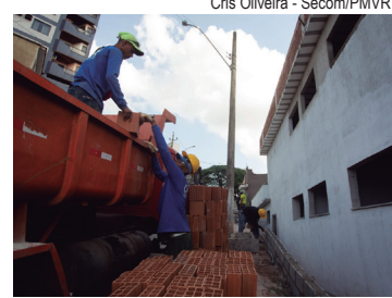
Projeto precisou de adequações na entrada e sala de espera

"Nosso objetivo é entregar um serviço que seja referência na região para o atendimento de cães e gatos. E é preciso destacar que as consultas e procedimentos serão gratuitos; a população de Volta Redonda poderá, em poucos meses, oferecer o melhor para seus amigos de quatro patas", afirmou o prefeito Antonio Francisco Neto.