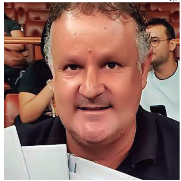
Caso é um suposto pagamento de ‘rachadinha’ durante seu mandato como vereador

O DIÁRIO DO VALE entrou em contato com o vereador e até o momento desta publicação ele não havia retornado as mensagens. O jornal está com espaço aberto para o vereador se manifestar sobre a decisão.