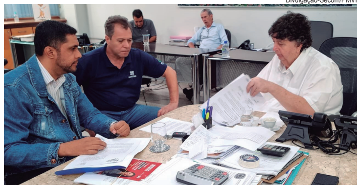
Parceria entre as secretarias de Desenvolvimento Econômico e Turismo (SMDET) e de Assistência Social (Smas) com a Firjan/Senai oferece 300 vagas para 13 áreas