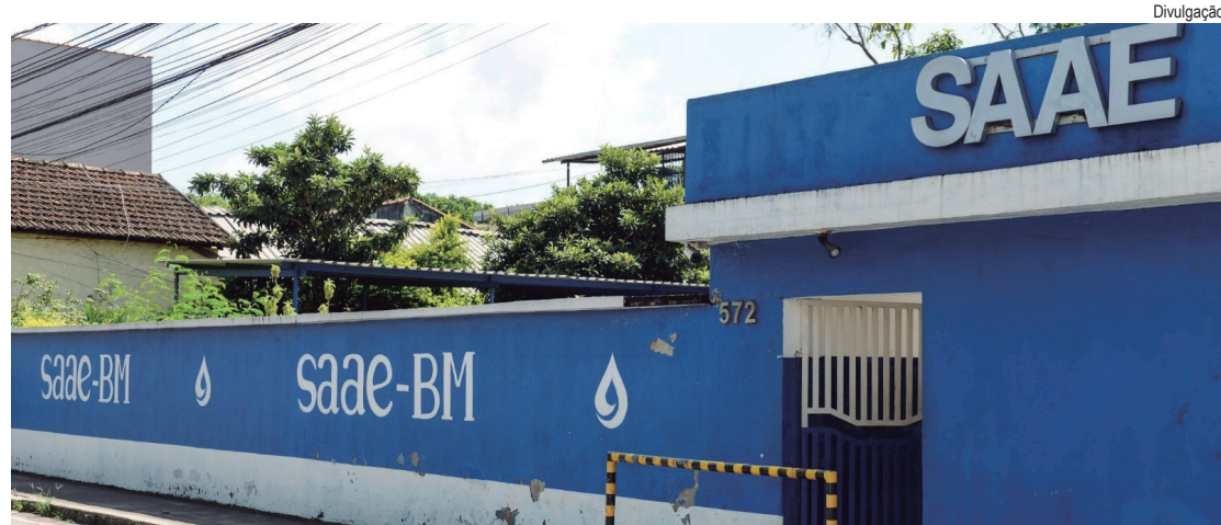
Ação proporciona mais agilidade e facilidade na quitação de débitos, além de garantir a emissão instantânea do comprovante de pagamento