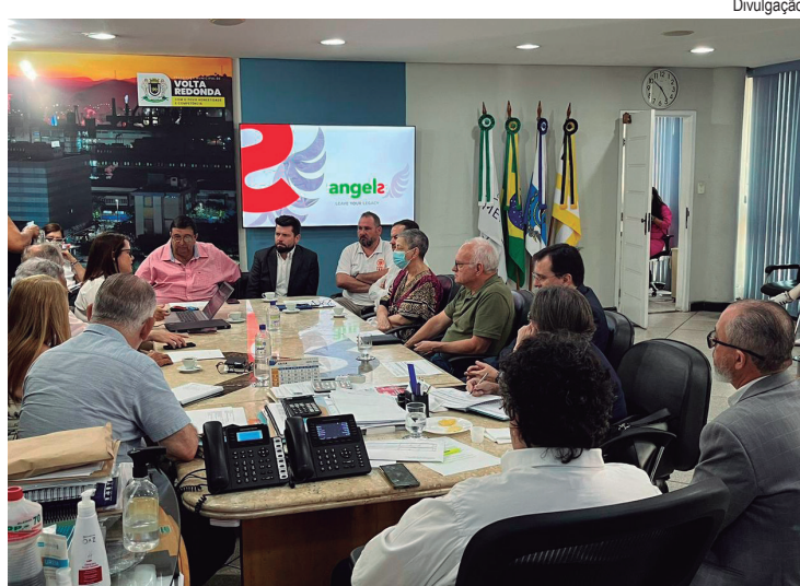
Grupo apresentou ao prefeito um projeto para melhorar o fluxo nos atendimentos de pacientes com AVC e AVE

De acordo com o deputado, o gerente da empresa,