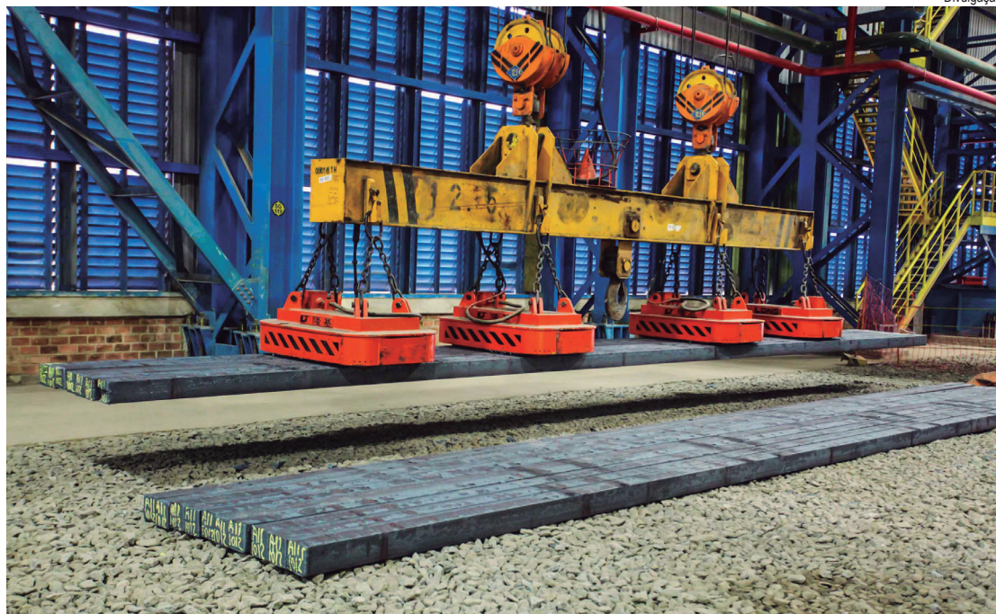
CSN explicou que a abordagem é focada na eficiência e na inovação

Além da UPV, outros segmentos da CSN estão aproveitando os benefícios da solução tecnológica. Na frota locada de veículos leves, mais de 200 carros de passeio estão sendo monitorados e tiveram sua utilização otimizada. Na unidade Casa de Pedra, em Arcos/MG, e na Ferrovia Transnordestina LTDA, em Fortaleza/CE, soluções de