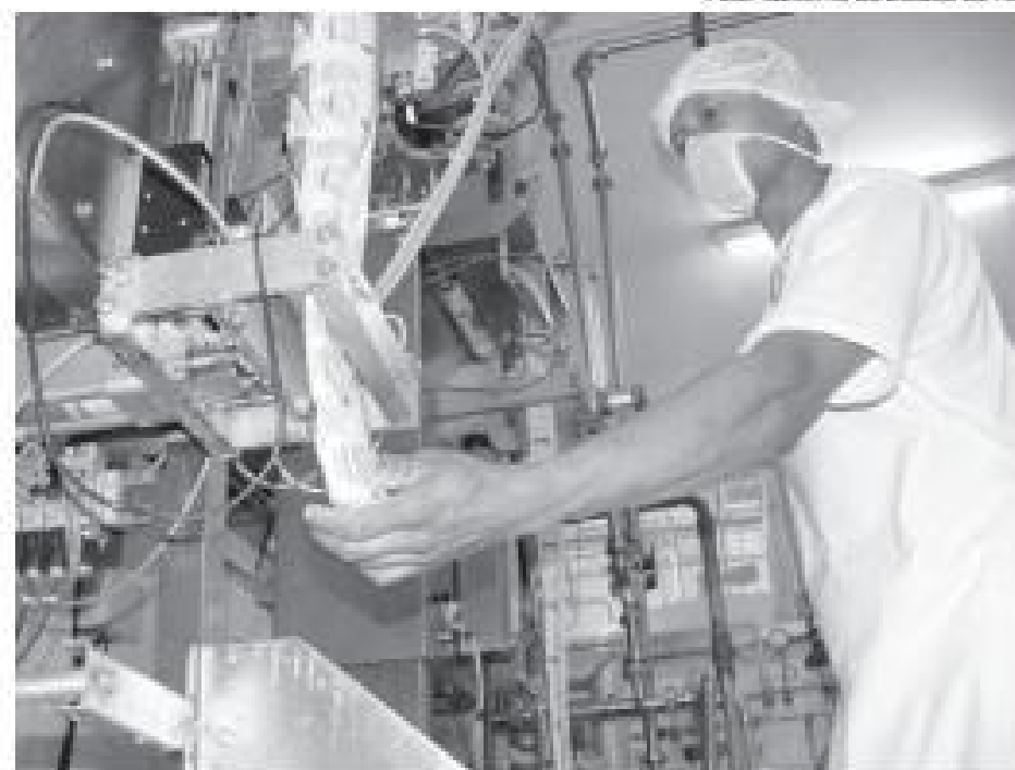
Estado se destaca pela liberdade para empreender