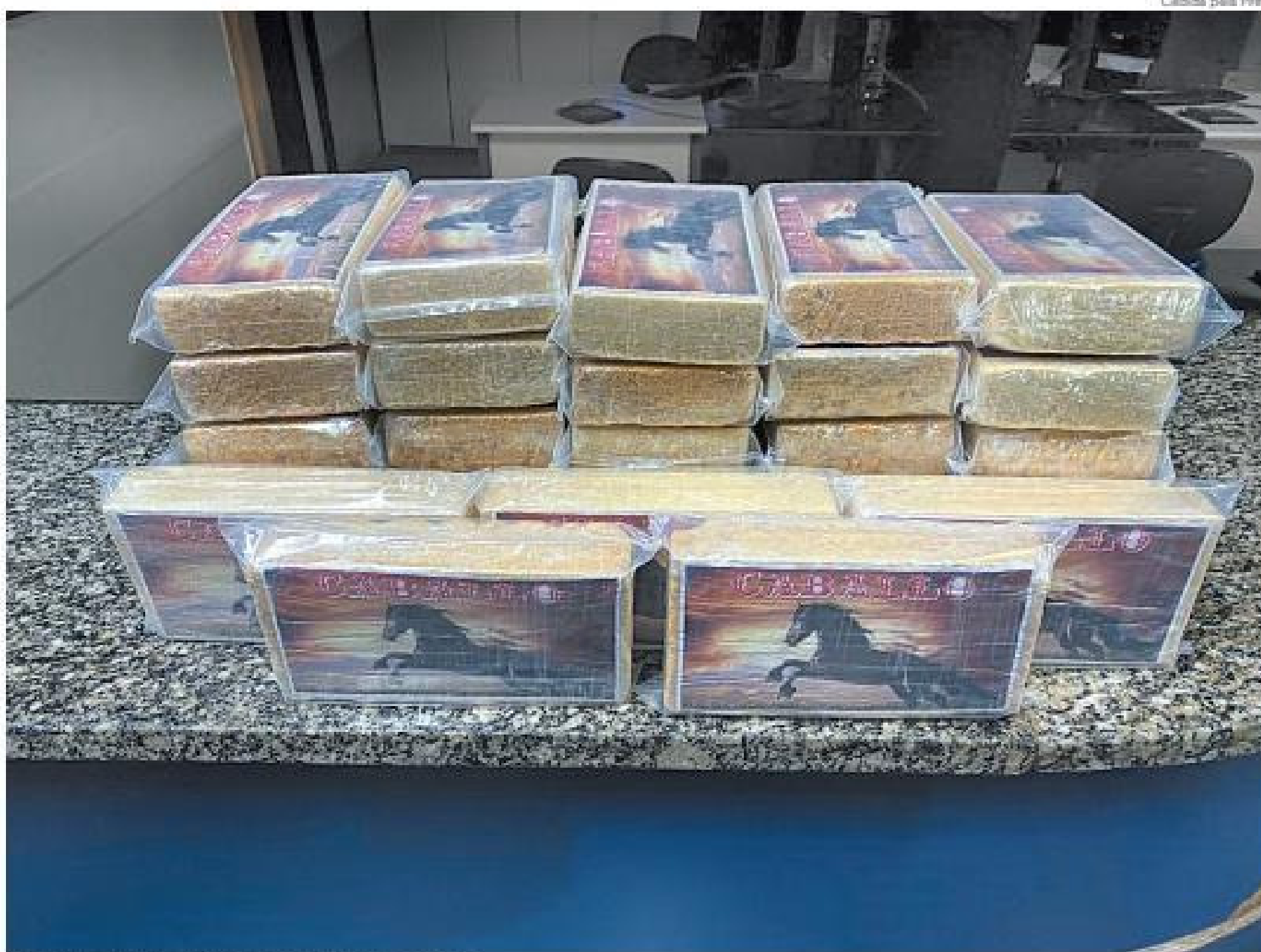
Carro levava 30 tabletes de pasta base de cocaína.

Material estava dentro de um Chevrolet Onix; motorista tentou fugir, mas foi alcançado