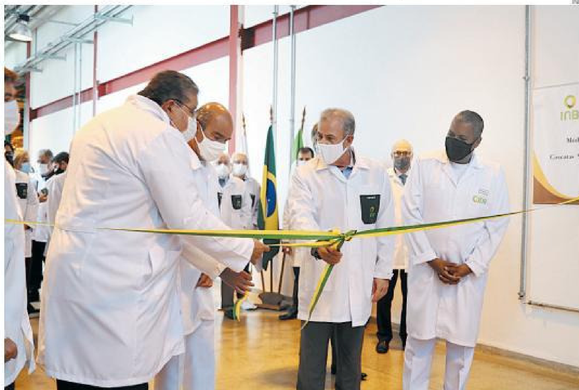
Ministro inaugura nova cascata de enriquecimento de urânio

Na sequência, o ministro de Minas e Energia enfatizou a importância da autoestima para a superação e concretização de realizações como a inauguração da 9ª cascata de enriquecimento de urânio da INB e ressaltou a importância da força de trabalho, dos colaboradores, conselhos fiscal e de administração nesse processo. "Vocês conseguiram isso superando desafios que já vem de anos e também mais de 700 dias de pandemia. Isso a meu ver é motivo para orgulho e autoestima", disse.