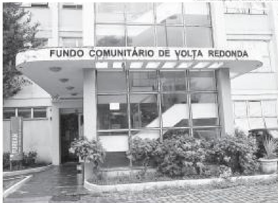
Atendimento presencial para pedir desconto no IPTU é feito no Furban, ao lado da prefeitura