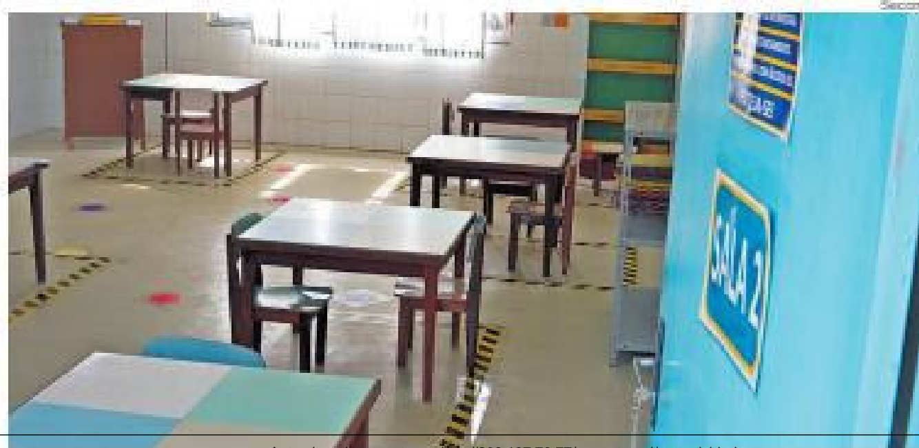
Depois de quase um ano e meio, salas de aula voltam a ter alunos e professores

Cerca de 20 mil alunos da rede municipal retornam às aulas presenciais nesta segunda-feira, segundo informou a Secretaria Municipal de Educação. O retorno ocorrerá em sistema híbrido - online e presencial - após profissionais da Educação terem recebido a aplicação da segunda dose da vacina contra Covid-19. A volta será para todos que optarem pelo ensino híbrido, desde a Educação Infantil até o Ensino Médio - incluindo EJA (Educação de Jovens e Adultos). Estão previstas atividades remotas para o complemento da carga horária diária.