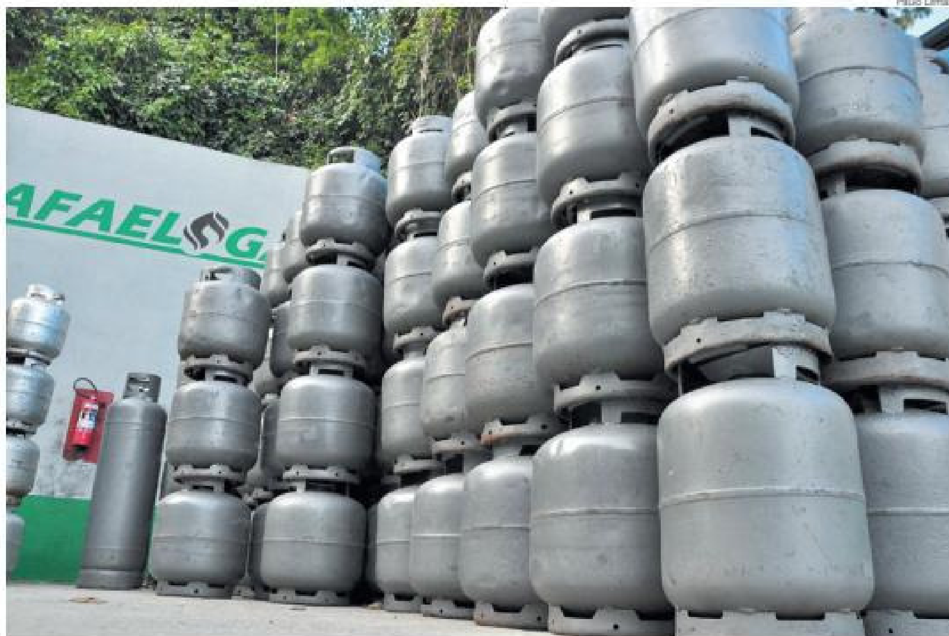
Reajuste no preço do gás afeta quem trabalha como autônomo e teme repassar aumento para clientes

Lucro de quem trabalha por conta própria cai drasticamente com índices de inflação registrado nos últimos meses