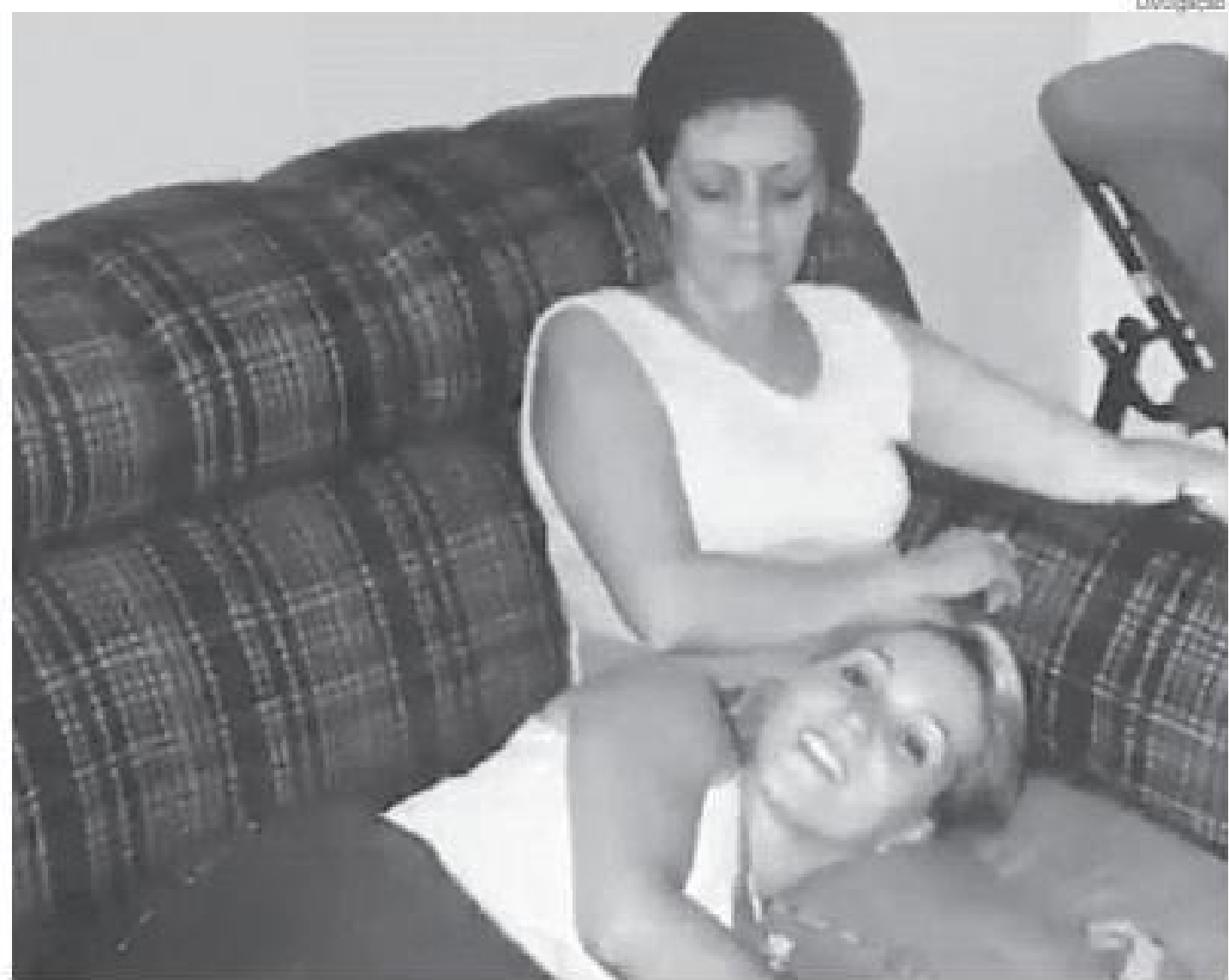
Filha fala sobre a importância da força da família e como a depressão precisa ser levada a sério

O Centro de Valorização da Vida (CVV) realiza apoio emocional e prevenção ao suicídio, atendendo voluntária e gratuitamente todas as pessoas que querem e precisam conversar, sob total sigilo por telefone, e-mail e chat 24 horas, todos os dias. Os canais de contato podem ser acessados através do site do CVV (cvv.org.br/) e o número para contato é o 188.