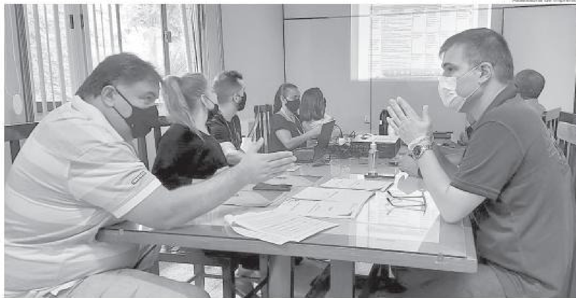
Furtado fala sobre verbas destinadas à AAP-VR

Além dos projetos em andamento, a Associação lançará o programa "Turismo Inclusivo", com a utilização da Sede Campes-