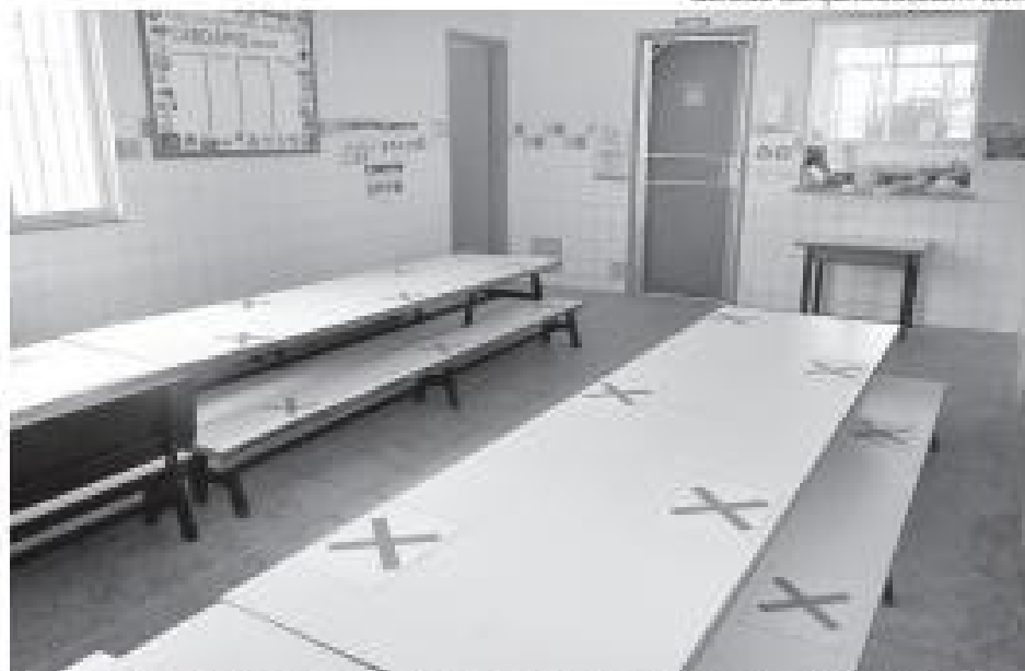
Secretaria de Educação de Volta Redonda se prepara para receber mais de 20 mil alunos na volta às aulas

nizou para receber alunos que queiram fazer refeições no colégio. Todo estudante terá direito, conforme o horário pré-estabelecido pela escola. Para saber mais, é preciso ligar para a unidade escolar.