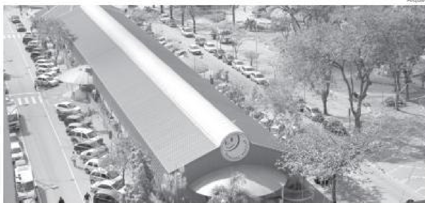
Quiosques ficam localizados na praça de alimentação do Mercado Popular, na Rua 12

A Polícia Civil também registrou na madrugada de sexta-feira, dia 10, o arrombamento a uma loja especializada em venda de celulares. O estabelecimento fica localizado na Avenida Paulo de Frontin com a Rua Luiz Alves Pereira, no bairro Atarrado. O material furtado e o valor do prejuízo não foram revelados pela polícia.