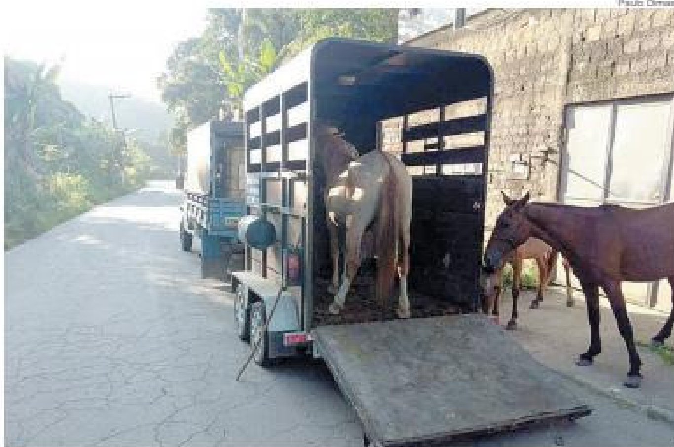
Empresa irá recolher animais de pequeno e médio porte nas ruas de Barra Mansa