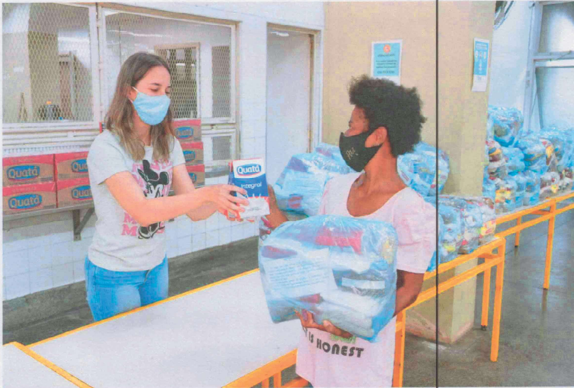
Entrega dos Kits de segurança alimentar na Escola Municipal Cruz e Souza: